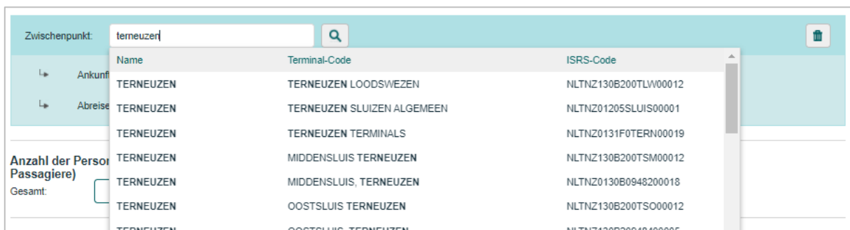
Abb. 4: Zwischenpunkt Terneuzen wählen

Nach der Anmeldung Ihrer ETA-Zeit über die BICS-Software sind Sie bei der Schleuse Terneuzen eingeplant und vorgemeldet.