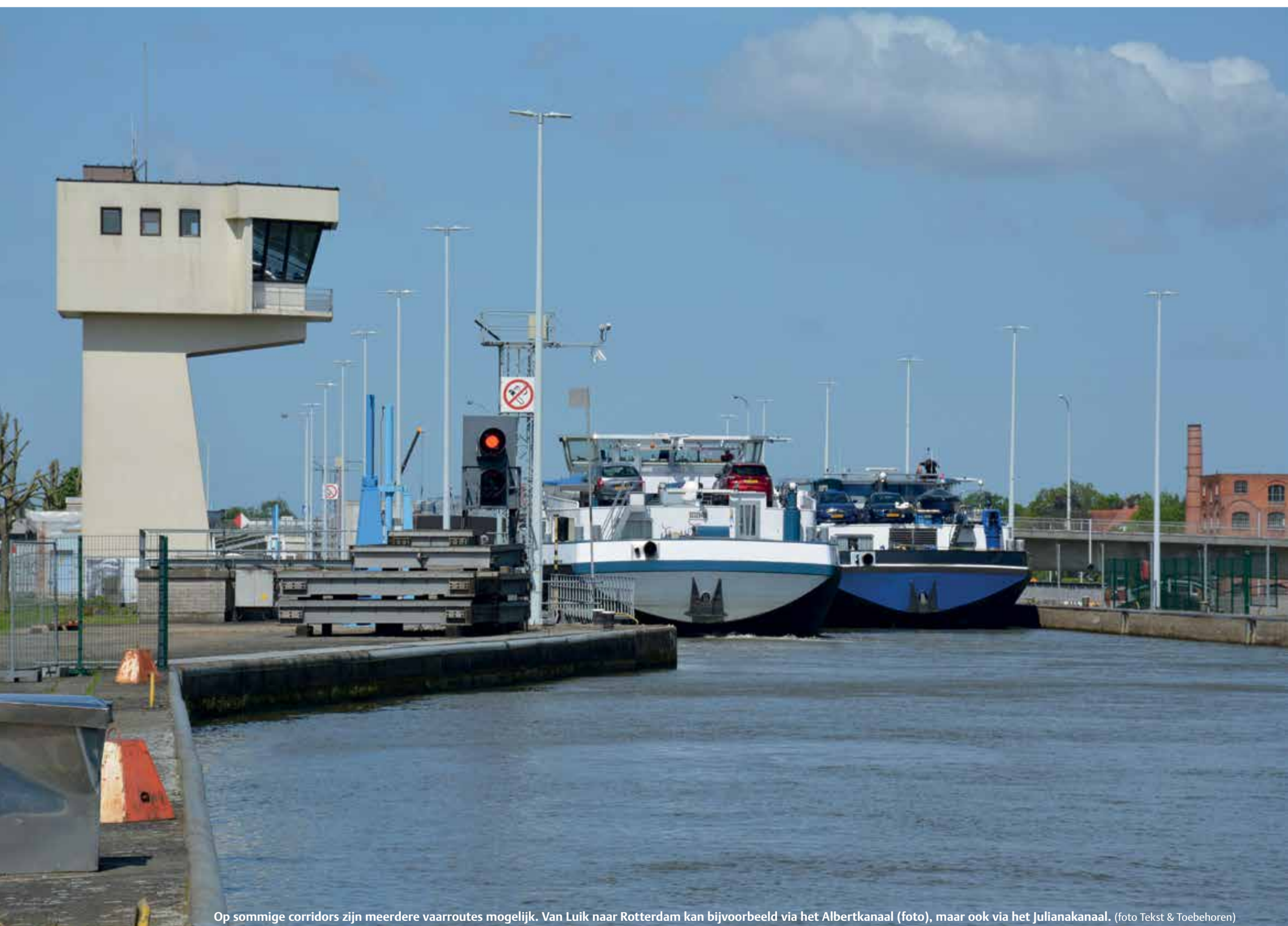
Op sommige corridors zijn meerdere vaarroutes mogelijk. Van Luik naar Rotterdam kan bijvoorbeeld via het Albertkanaal (foto), maar ook via het Julianakanaal.

Uitleg over het aanmelden van reizen in Vlaanderen staat onder meer bij de veelgestelde vragen (FAQ) op www.BICS.nl . Daar valt te lezen: "De reis moet aangemeld zijn bij het eerste meldpunt "VLAAMSE WATERWEGEN". Er moeten minimaal twee tussenspuncten worden ingevoerd bij het aanmaken van de reismelding. Als tussenspuncten kunt u het beste een sluis of kunstwerk op de route opgeven."