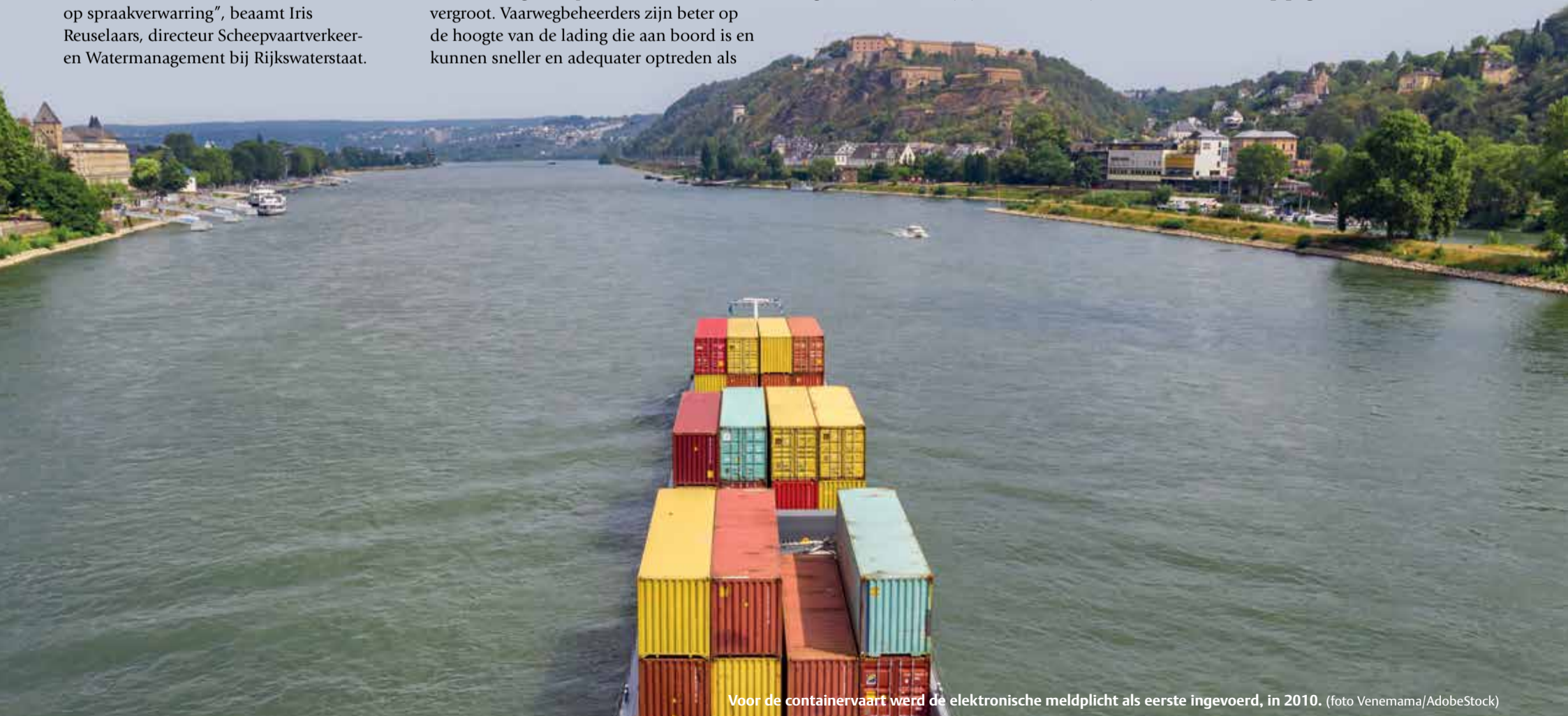
Voor de containervaart werd de elektronische meldplicht als eerste ingevoerd, in 2010.