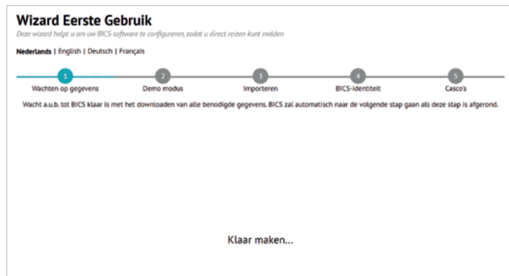
Een van de vernieuwingen is de vereenvoudigde wizard voor het eerste gebruik.

De Product Owner is trots op zijn team. “Op de eerste plaats om het niveau van hun kennis en de inzet die ze tonen. En hoe bewust het team omgaat met de kwaliteit van de software. Ze leggen de lat echt hoog voor zichzelf.”