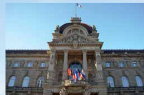
De Centrale Commissie voor de Rijnvaart, gevestigd in het Palais du Rhin in Straatsburg, heeft onlangs definitief vastgesteld dat de uitbreiding ingaat op 1 december 2026.

Het duurt nog ruim twee jaar voor het 1 december 2026 is. De CCR is, samen met de lidstaten, al begonnen met de voorbereiding om het besluit uit te voeren. Zo is er een communicatieplan ontwikkeld, vertelt Wisselmann. "De aanpak is in principe hetzelfde als bij de vorige fasen." Om elektronisch te kunnen melden, dienen schippers software voor elektronisch melden te downloaden en een account aanmaken. Dat kan gratis met BICS. "De CCR moedigt schippers aan om dit zo snel mogelijk te doen", zegt Wisselmann tot slot. Algemene informatie over elektronisch melden is te vinden op de CCR-website: www.ccr-zkr.org/12040800-nl.html . Die pagina wordt de komende maanden bijgewerkt en aangevuld.